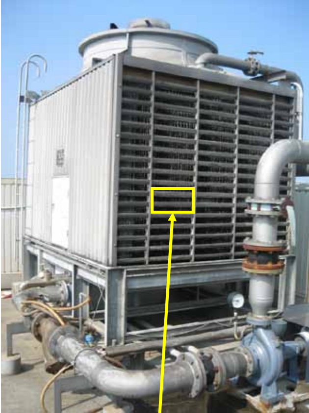
無設置 3 ヶ月後

N 企業様（大手冷凍加工食品会社）長崎県 藻の除去対策で設置 MMF-100A（循環水仕様） 冷却塔コンデンサーのフィン部に藻の発生で長年困っていました。 冷却塔 6 基のうち 1 基に“無雑”を設置し効果の比較をしました。 （全体写真の掲載は N 企業様の了解が得られません。）