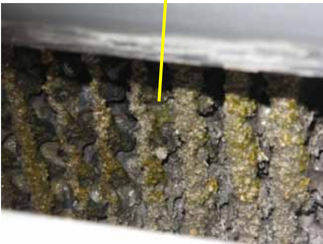
藻が繁殖し進行している