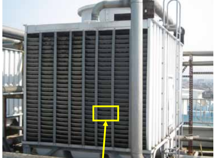
“無雑” 設置 3 ヶ月後